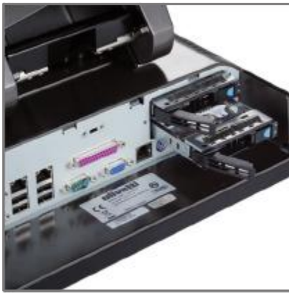
DUAL LAN, ZWEI AUSTAUSCHBARE FESTPLATTEN UND RAID FUNKTION