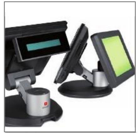
VFD KUNDENANZEIGE ODER ZWEITES TFT-LCD DISPLAY (optional)